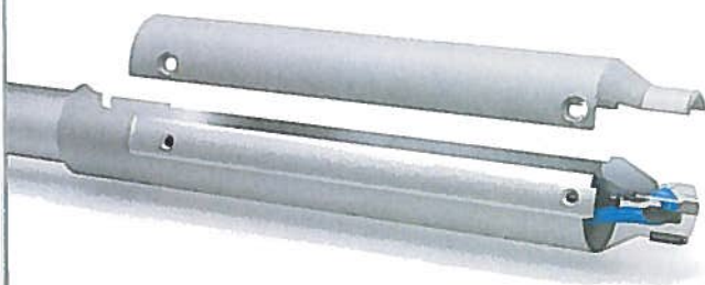
3D-Modell des Hülssensenkers

Nach mehreren Optimierungsschritten und Versuchsdurchläufen ist ein maßgeschneidertes PKD-Aufbohrwerkzeug entstanden, das mittels selektivem Lasersintern gefertigt wird. Dieses Verfahren erlaubt es, aus Metallpulver beliebige dreidimensionale Konstruktionen in nur einem Arbeitsdurchlauf und ganz ohne Werkzeuge aufzubauen. Die Ingenieure des Werkzeugherstellers haben die sich hieraus ergebenden neuen Möglichkeiten genutzt, um die Kühlkanäle des Hülssensenkers neu anzuordnen. Dabei sind die Kühlkanäle weiter nach außen gewandert, wodurch die Spanraumgeometrie vergrößert werden konnte. Zum anderen wurde der