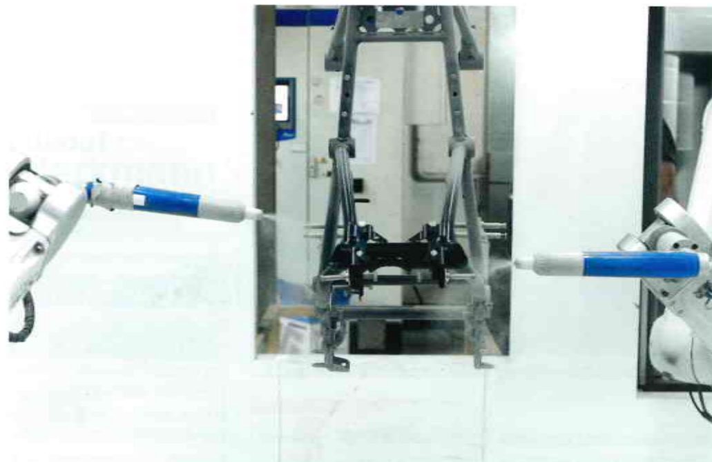
Die neue Technik bietet einen großen Bewegungsspielraum für die Roboter und ist dennoch sehr platzsparend auf nur 20 m 2 untergebracht.

Um den Lackieraufwand für die Oberflächenveredelung von Automobil- und Motorradteilen nachhaltig zu senken, entschloss man sich bei WELCO, die Beschichtungsprozesse komplett zu automatisieren. Die Ausschreibung für einen neuen Paintshop erhielt Hersteller Nordson und stattete die Anlage mit dem Pulverzentrum „Spectrum HD“ sowie mit „Encore HD“-Automatipistolen aus. Für die Kombination von Robotern und Dichtstrom-Technologie sprachen laut Geschäftsführer Richard Nuber gleich mehrere Gründe: „Wir haben uns für die Dichtstrom-Applikation entschieden, um das Handling mit den Bauteilen zu vereinfachen und Overspray zu reduzieren. Außerdem lässt sich mit dieser Technik eine höhere Eindringtiefe und