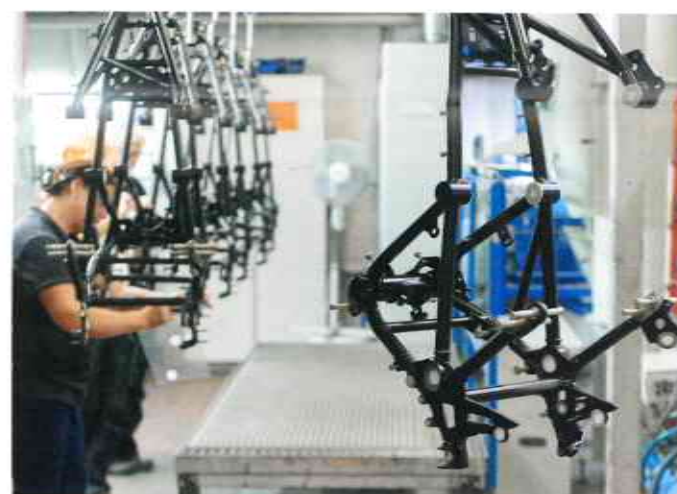
Die Produktion läuft konstant; durch vielfach anpassbare Programme konnte der Lohnbeschichter die Flexibilität steigern.

haben wir unsere Qualität deutlich steigern können. Und wir brauchen einen Bediener pro Schicht weniger. Letztlich hat das zu einer Umsatzsteigerung von 7,4 Mio Euro in 2015 auf 9,1 Mio Euro in 2017 geführt“, erklärt er zufrieden. Darüber hinaus bietet die neue Beschichtungsanlage die Möglichkeit, alle Daten zu erfassen. Das erlaube einen einfachen Zugang zu Applikations- und Steuerungsparametern. Durch die Anlagenautomatisierung laufe die Produktion konstant, und durch vielfach anpassbare Programme sei die Flexibilität gestiegen sowie die Abhängigkeit von Bedienerqualifikation gesunken.